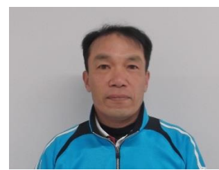
〈えひめ広域スポーツセンター〉