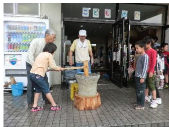
こどもの日まつり