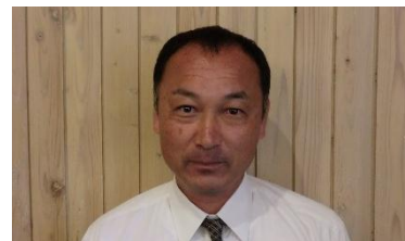
(南予担当 藤山尚史)