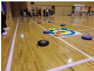
会員交流カローリング大会